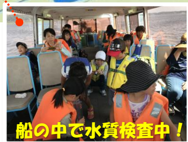
船の中で水質検査中!