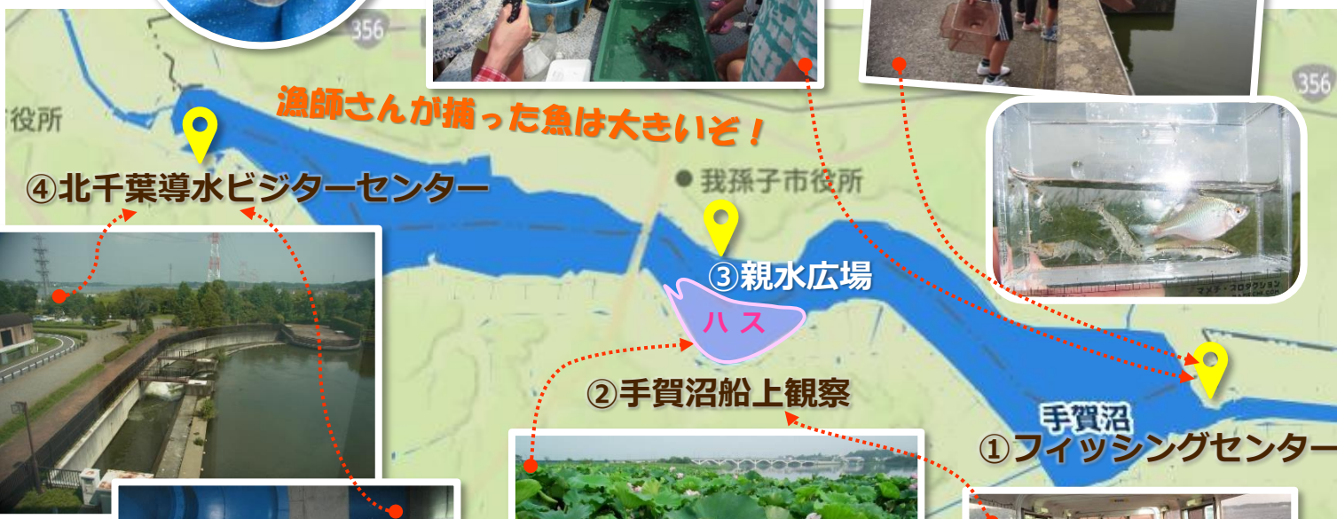
漁師さんが捕った魚は大きいぞ!