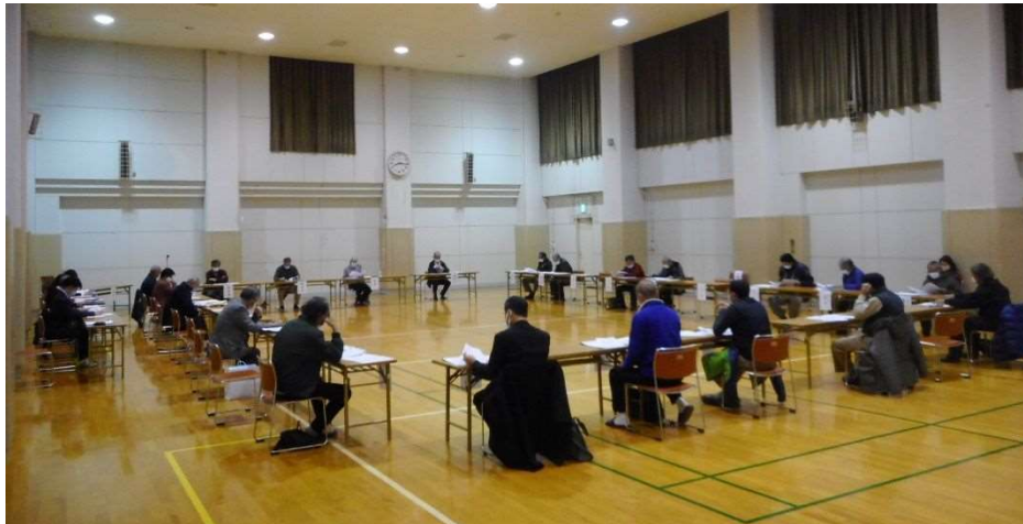
議案を審議する準備会委員の皆さん。

12月19日（土）、公民センターで「白井第二小学校区まちづくり協議会設立準備会」が開催されました。