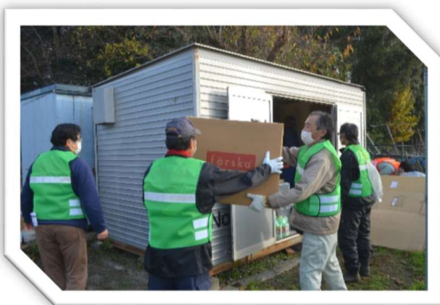
昨年度の防災訓練の様子