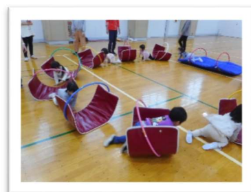
昨年度の体操教室の様子