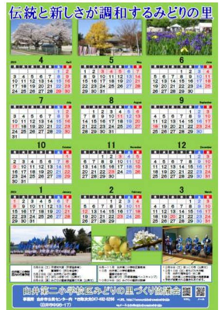
令和5年度 みどりの里 カレンダー

届いていない方には、公民センターで配布していますので、お申し出ください。(電話492-5266)