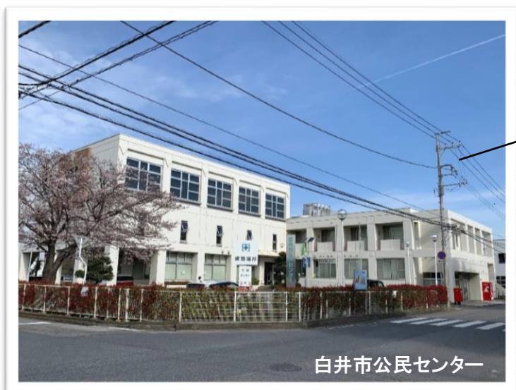
白井市公民センター