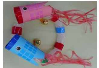
りんりんこいのぼりリング