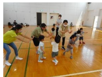
昨年度の体操教室の様子