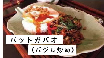
パットガバオ (バジル炒め)