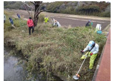
前回の篠狩りの様子