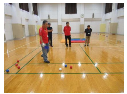
スポーツ推進委員の方の説明を聞いている様子

公民センターでは、多くの皆さんに体験していただけるよう 12 月から月一回、「ポッチャの日」を決め、楽しんでいただくこととなりました。