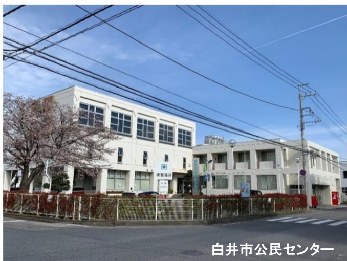
白井市公民センター

日 時：11月2日（土）10：00～12：00 雨天中止 内 容：「富塚学校跡」の看板の設置と周辺の史跡散策と環境整備