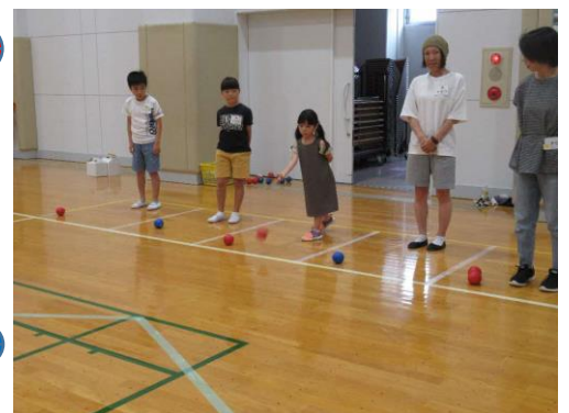
実際に体験している様子

公民センターでは、多くの皆さんに体験していただけるよう 12 月から月一回、「ポッチャの日」を決め、楽しんでいただくこととなりました。