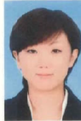
七次台小学区 小田川 長

通学合宿やイベントに参加してくれた子がその後市内で会うと声をかけてくれた相談員をやって良かったなと思います。自分自身も楽しみなが頑張りたくて留まっています。