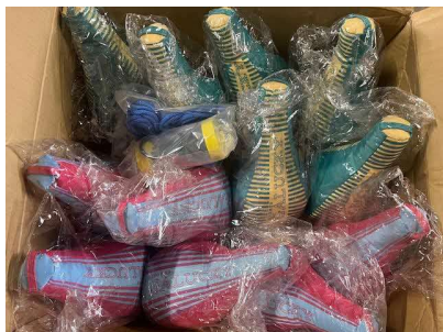
ガラッキー:2セット