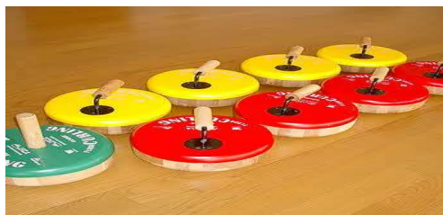
ペタンク(屋内用):4組