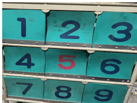
ディスクキャッチャー:2基