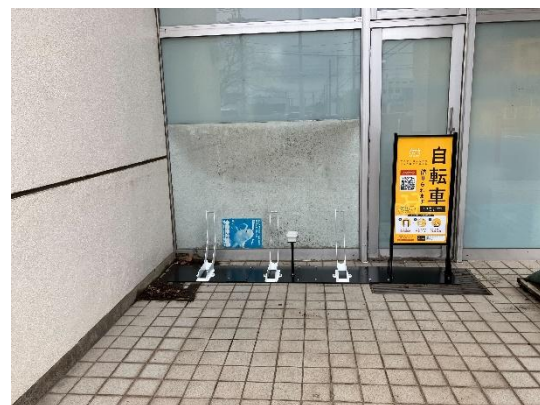
シェアサイクルステーション (郵便ポスト付近)