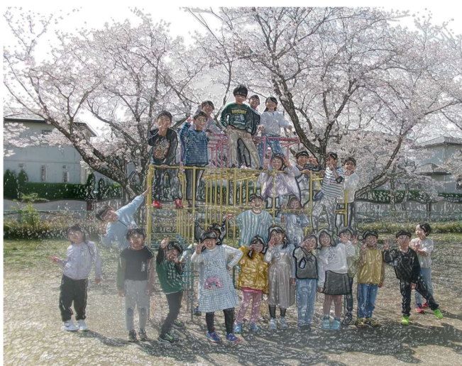
天気の日が多く、過ごしやすいですね。