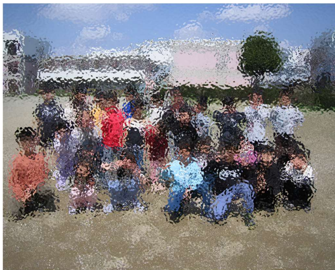
2年生がスタートしました！