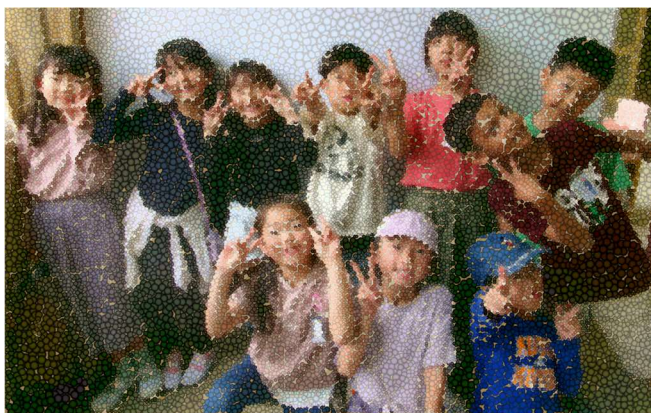
これから、仲良くよろしくお願いします！