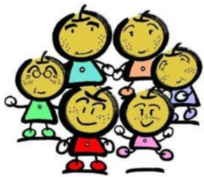
白井市マスコットキャラクター 「なし坊ファミリー」。